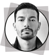
arch. TOMAS GHISELLINI Tomas Ghisellini Architetti