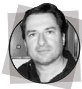
arch. FABIO CORACIN Fedro Architetti Associati