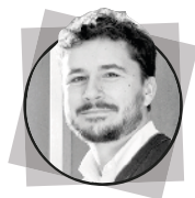
arch. PAOLO PANETTO EXIT architetti associati